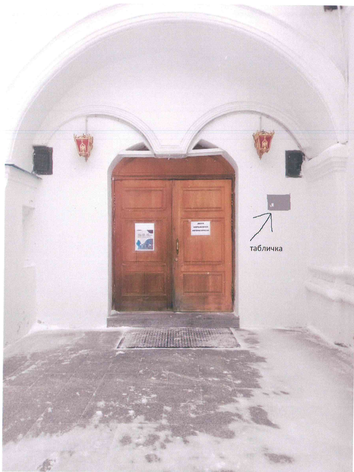
Пути подхода к информационной надписи со стороны улицы Марата, высота размещения информационной надписи: 2800 мм.